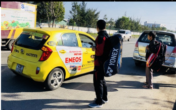
Tài xế xe 75K-5504 chôn đ i, bắt hợp tác với cơ quan chức năng, bắt r i hành khách khi bắt l p bị