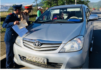
Kiểm tra, thu thập thông tin, làm rõ hành vi vi phạm có tính tổ chức của xe ph